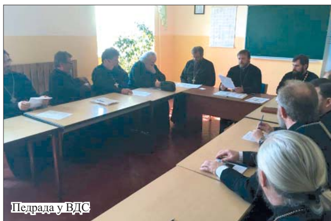
Педрада у ВДС

12 серпня , у п'ятницю, у ВДС відбулося засідання педради, яке очолив ректор протоієрей Рустик Капауз. Було підведено підсумки цьогорічної вступної кампанії. Так, згідно результатів вступних іспитів, на I курс зараховано 30 абітурієнтів, ще двоє осіб, відповідно до продемонстрованих ними знань, були зараховані на II курс ВДС. Після завершення педради абітурієнтам було оголошено список зарахованих.