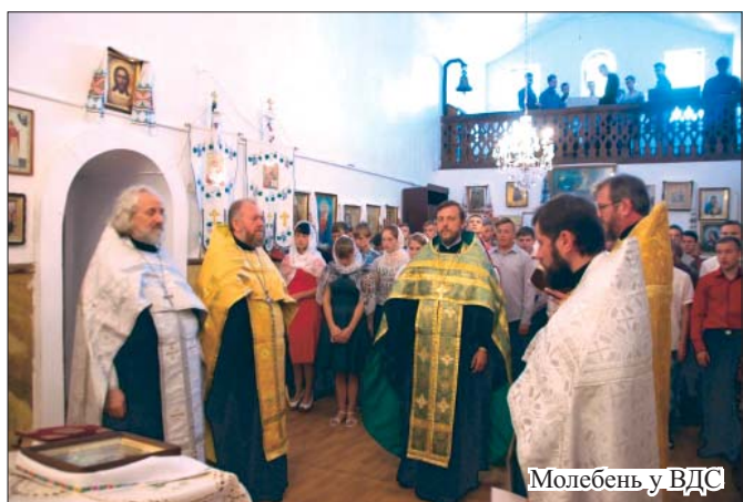
Молебень у ВДС

8 серпня , у понеділок, у ВДС відбувся молебень перед початком вступних іспитів. Очолив його ректор ВДС, якому співслужили інші представники адміністрації семінарії. Участь у молитві взяли чотири десятки абітурієнтів ВДС.