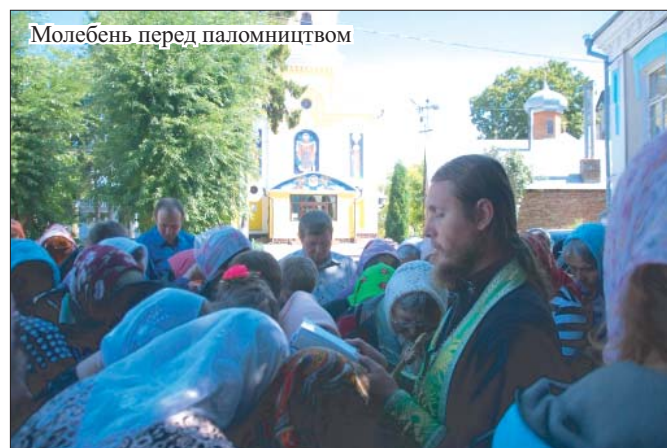
Молебень перед паломництвом